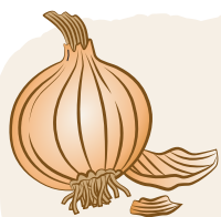
ONION SKIN kitchen by-product